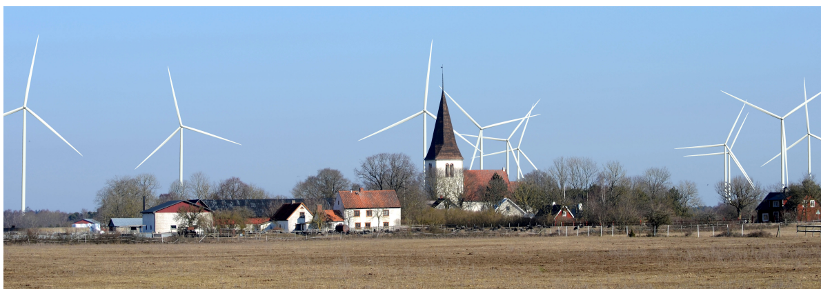
Vy mot Slite kyrka och Mästermyr (E20). Visualisering av Richard Bernström Akustik HB.

Mot denna bakgrund bedömer SBF att det är synnerligen anmärkningsvärt att regionen tycks anse att det är närmast ett axiom att just denna ö med sina unika kulturvården ska "gå före i energiomställningen" och lanseras som "energiön". Enligt Genomförandeprogrammet för klimat, energi och miljö , fastställt av regionfullmäktige 2022, ska en sammanlagd installerad effekt från vindkraft på 1000 MW på Gotland uppnås till 2027; denna kraftiga satsning trots att regeringen genom Energimyndigheten inte längre pekar ut Gotland som pilot i energiomställningen. Ytanspråken för denna storskaliga satsning på vindkraft motsvarar sammanlagt cirka 160 kvadratkilometer (s 159-160). SBF uppskattar utifrån kartredovisningen att minst en tredjedel av kyrkorna kommer att ligga i omedelbar närhet, cirka 2-5 km, från vindkraftverk. Endast cirka en tredjedel bedöms komma att ligga mer än en mil från vindkraftverk, vilket dock inte hindrar att även dessa kyrktorn på längre avstånd kommer att få konkurrens i vyerna av de höga kraftverkstornen som syns milsvitt med vindsnurror som fångar blicken.