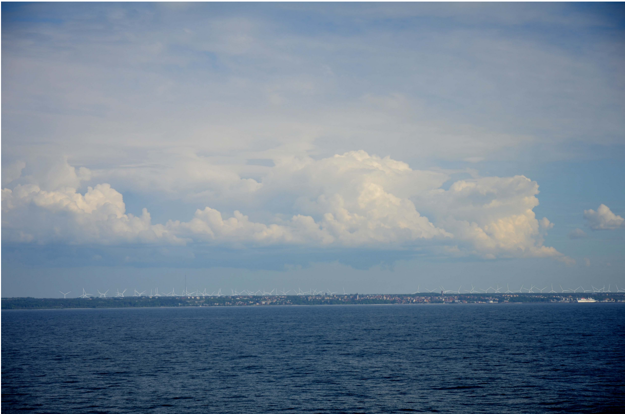
Vy mot Gotland 11 km från land. De 300 meter höga kraftverken i Lojsta-Ljugarnområdet syns över Visbys siluettlinje. Visualisering av Richard Bernström Akustik HB.

Sektion från fotopunkt på färjan (däck 8) som visar hur stor del av verket / verken som syns ovanför domkyrkans torn i tre olika visualiseringar.