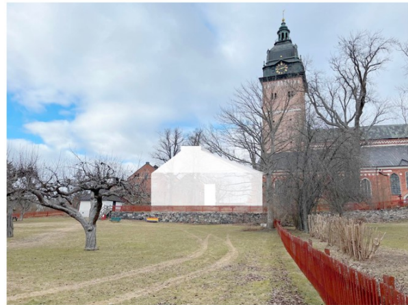
Bild visar byggnadens påtagliga skada på riksintresset mot söder: trädgårdarna, biskopsgårdarna och vattnet. Här framträder byggnadens dominans mot Månssons trädgård. Betydande sprängningar måste utföras av själva kyrkberget. Skadan på topografi och orörda kulturlager är påtaglig. Kyrkan blir inte längre ensam solitär på berget utan skulle få konkurrens inom murarna med en byggnad som utmanar katedralens särart genom skala, material, höjd, form liksom i påverkan på genomblickar.