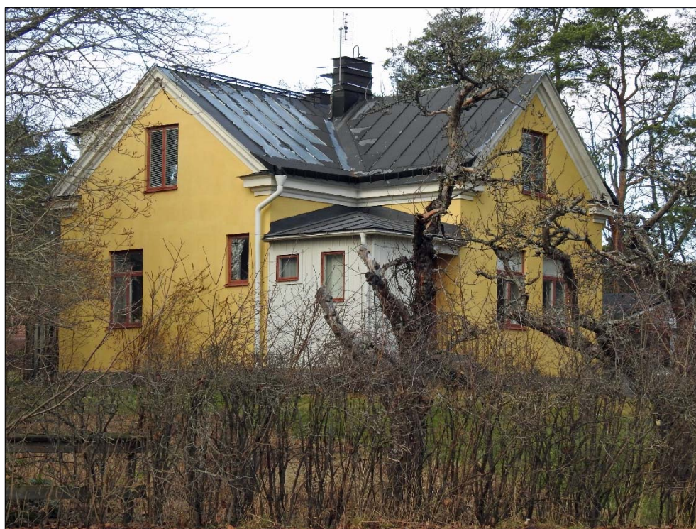
Fasad mot öster.

Enligt uppgift i Sveriges Bebyggelse, ett bokverk från omkring 1950, moderniserades byggnaden 1943. Möjligen kan den västra långsidans utsträckta takkupa och balkong ha utförts vid detta tillfälle, men det kan också ha skett något senare. I Sveriges Bebyggelse anges nämligen att byggnaden endast har tre rum, kök samt två hallar. Själva byggnaden var i privat ägo och värderades till 15 000 kr, men marken ägdes av Upsala-Ekeby AB.